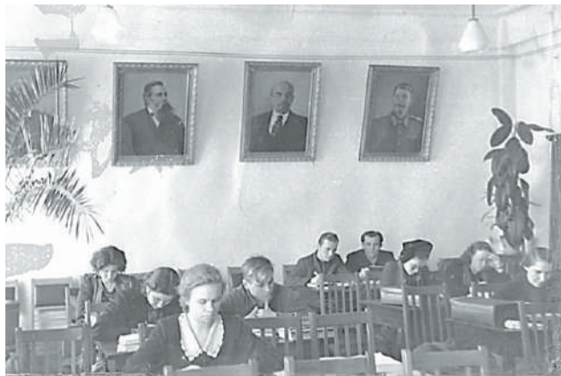
Методический кабинет кафедры марксизма-ленинизма, 1940-е гг.

История кафедры социально-исторических наук НГМУ напрямую связана с историей страны, с теми изменениями, которые происходят в ней и отражаются в преподаваемых дисциплинах. Со сменой государственных идеологических ориентиров неоднократно