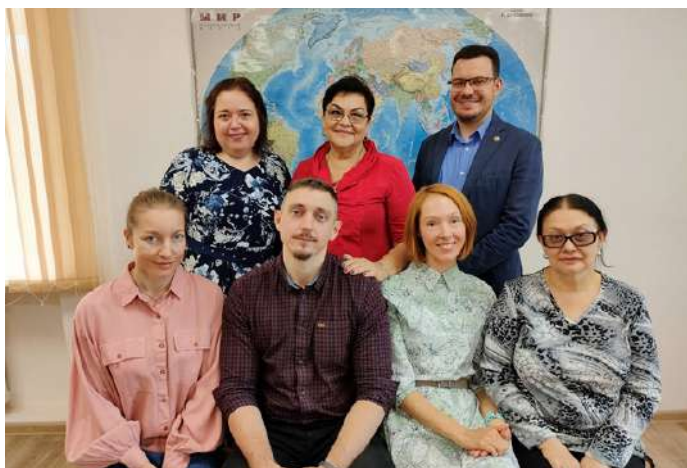
Коллектив кафедры социально-исторических наук, 2024 г.

С 2002 г. кафедра стала курировать музей истории НГМИ–НГМА–НГМУ (ныне Историко-просветительский центр). В тот же период возродилась группа «Поиск». Сбор информации о фронтовиках вышел на новый уровень благодаря интернет-порталам «Мемориал» и «Подвиг народа». Сегодня это направление работы особенно важно для формирования у молодого поколения чувства патриотизма. К 70-летию Победы вышла книга памяти НГМУ «Живем и помним». Она посвящена преподавателям и сотрудникам НГМИ – участникам боевых действий и консультантам эвакогоспиталей в 1941–1945 гг., а также выпускникам НГМИ, пропавшим без вести и погибшим на фронтах Великой Отечественной войны. Книга увидела свет благодаря усилиям нескольких поколений студентов и преподавателей кафедры социально-исторических наук.